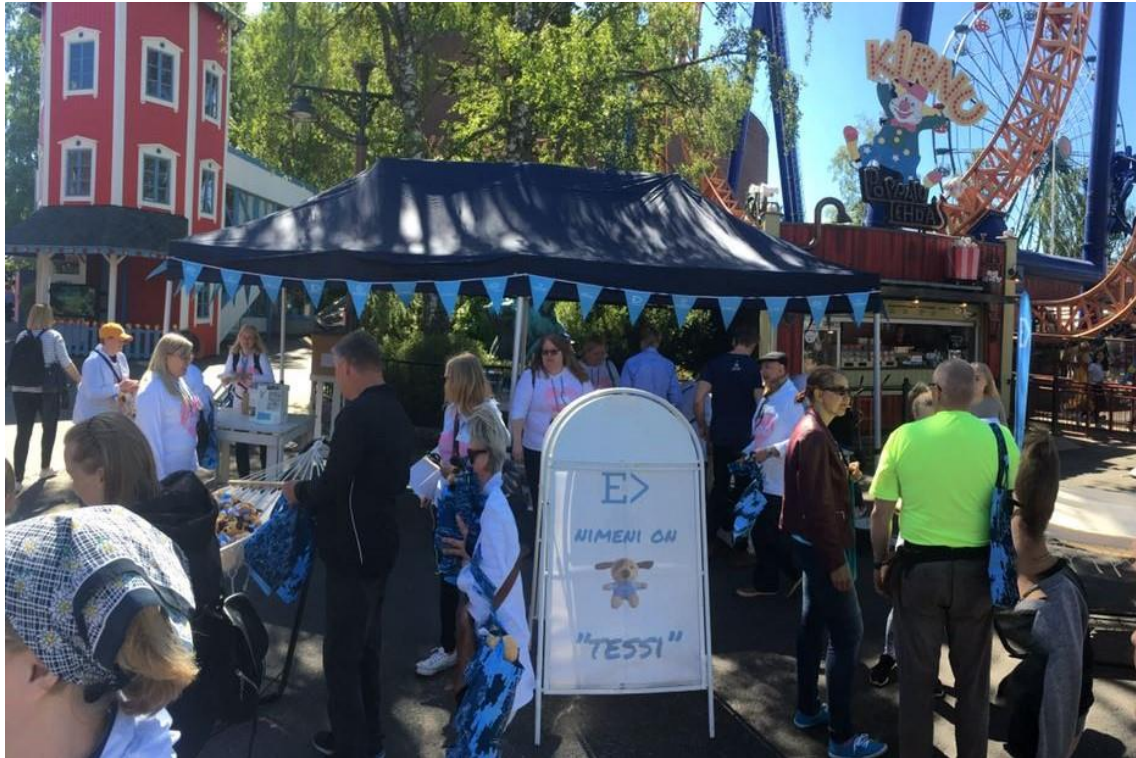
ERTO 50v. Linnanmäki

ERTOn 50v. juhlakarnevaalit vietettiin 9.6.2018 Linnanmäellä Helsingissä. Ystealaisia oli saapunut paikalle 131 ja ertolaisia perheineen yhteensä 3100 henkilöä.