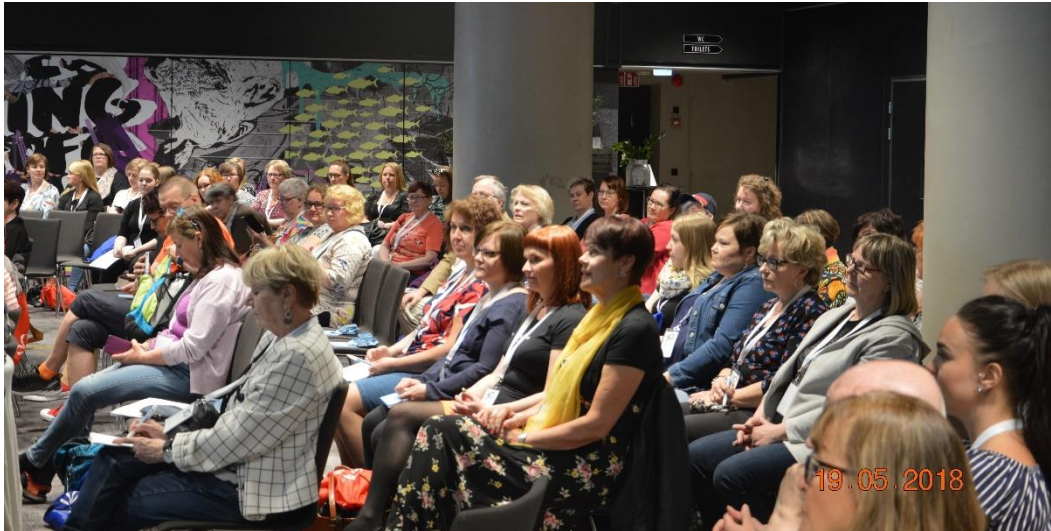
Ertolaisten yhteinen kevätkokous, 292 jäsentä paikalla

Kevätkokous pidettiin 19.5.2018 Helsingissä Hotelli Radisson Blu Seasidessa. Kaikki ERTOn kuusi jäsenyhdistystä kokoontuivat yhteisen ohjelman ääreen. Jonka jälkeen yhdistykset pitivät omat kevätkokouksensa, ystealaisia oli paikalla 72. Yhteisen lounaan jälkeen ystealaiset lähtivät Tallinnan risteilylle virkistytymään.