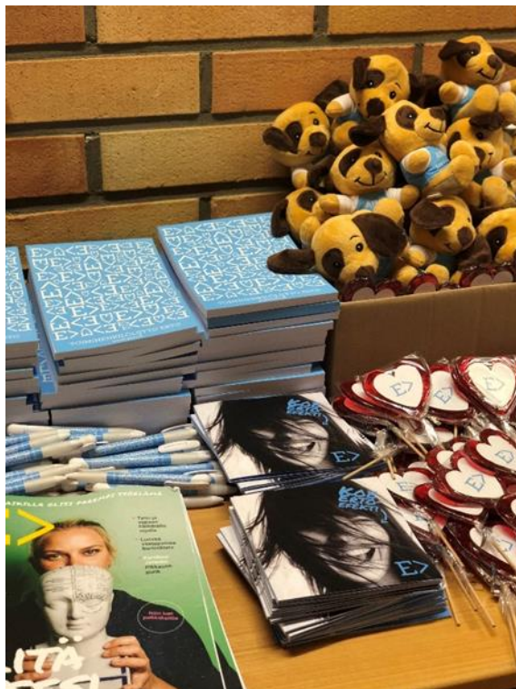
Psoriasisliiton paremmat kahvit, kuva Kirsti Karttunen/ HUMAK-kiertue, oppilaitoskäynti